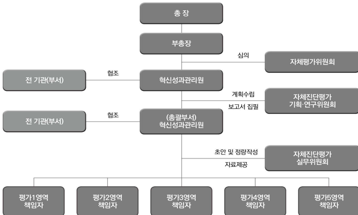
〈그림 1-1〉 자체진단평가 추진 체계도